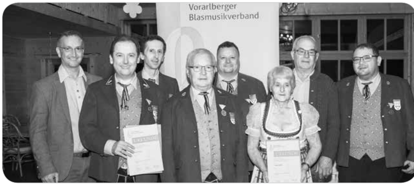
Der Vorarlberger Blasmusikverband ehrte Ludescher Musikanten und ihre Unterstützer.