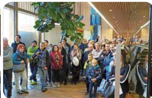
Das Ergebnis der Abstimmung wurde nicht nur in Ludesch mit Spannung erwartet.