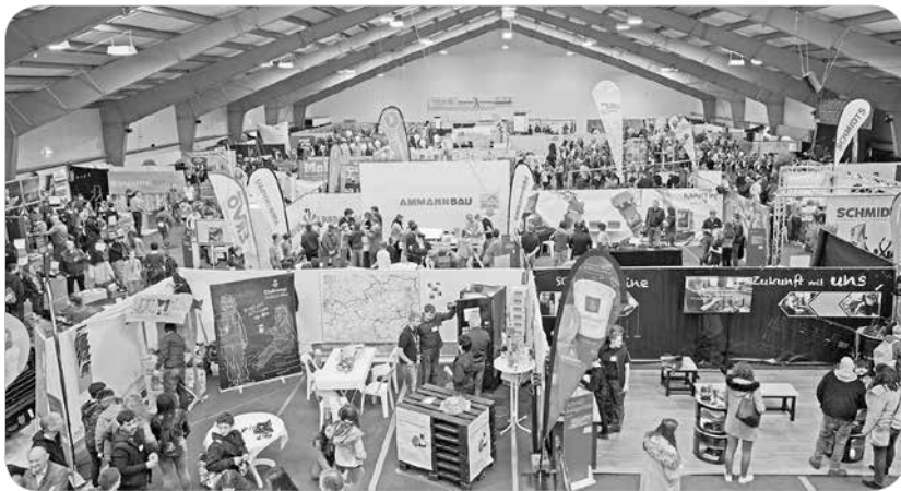
Am 15. und 16. November wird die Tennishalle zum Infoportal in Sachen Lehrberufe.